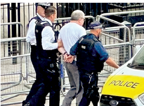
लंडन : आरोपीला तत्काळ अटक करण्यात आली.

असून, कारही जप्त करण्यात आली आहे. आरोपीने हे कृत्य जाणीवपूर्वक केले किंवा नाही, हे अद्याप स्पष्ट झाले नाही. या धडकेचा व्हिडीओही व्हायरल झालेला आहे. १० डाऊनिंग स्ट्रीट हे पंतप्रधानांचे निवासस्थान लंडनच्या वेस्टमिन्सटरमध्ये शहरात आहे. यापूर्वी २०१७ मध्ये ब्रिटनचे तत्कालीन पंतप्रधान डेव्हिड केमेरून यांना एक तरुणाने धावतच येऊन धडक दिली होती. त्यानंतर ब्रिटनमध्ये पंतप्रधानांना तसेच त्यांच्या निवासस्थानी सुरक्षा व्यवस्था वाढविण्यात आली.